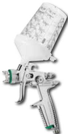
SATA RPS 0.3 I minijet 60 kelímků, víčka a Plochá sítká 125 mikron: Obj. č.: 118 299 Zásuvná sítká 200 mikron: Obj. č.: 118 414