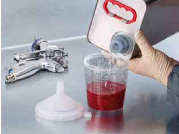
Namíchání laku probíhá v kelímku, s kterým se následně také lakuje.