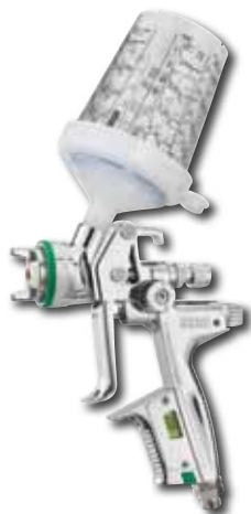
SATA RPS 0,3 I standard 60 kelímků, víčka a Plochá sítká 125 mikron: Obj. č.: 118 281 Zásuvná sítká 200 mikron: Obj. č.: 118 406